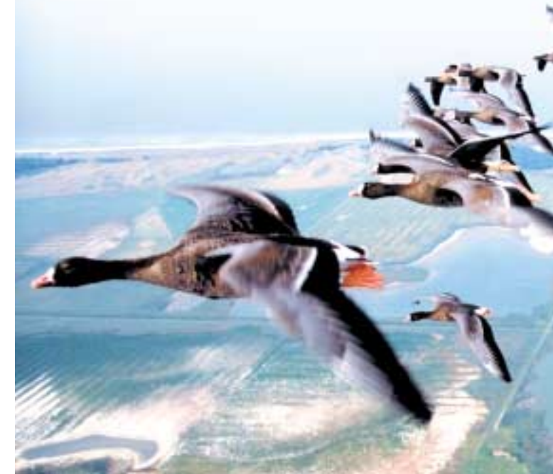
Ausgabe 2008 Illustration: www.ffab.net Gestaltung: www.think-about.net